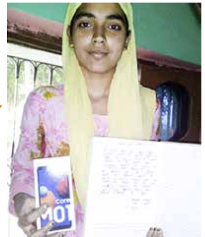
blijven leren ook in moeilijke tijden

Udayan Shalini Fellowship (USF) programma stimuleert in periode van 5-6 jaar de ontwikkeling van kansarme gemotiveerde meisjes tot krachtige en waardige vrouwen (Shalini's).